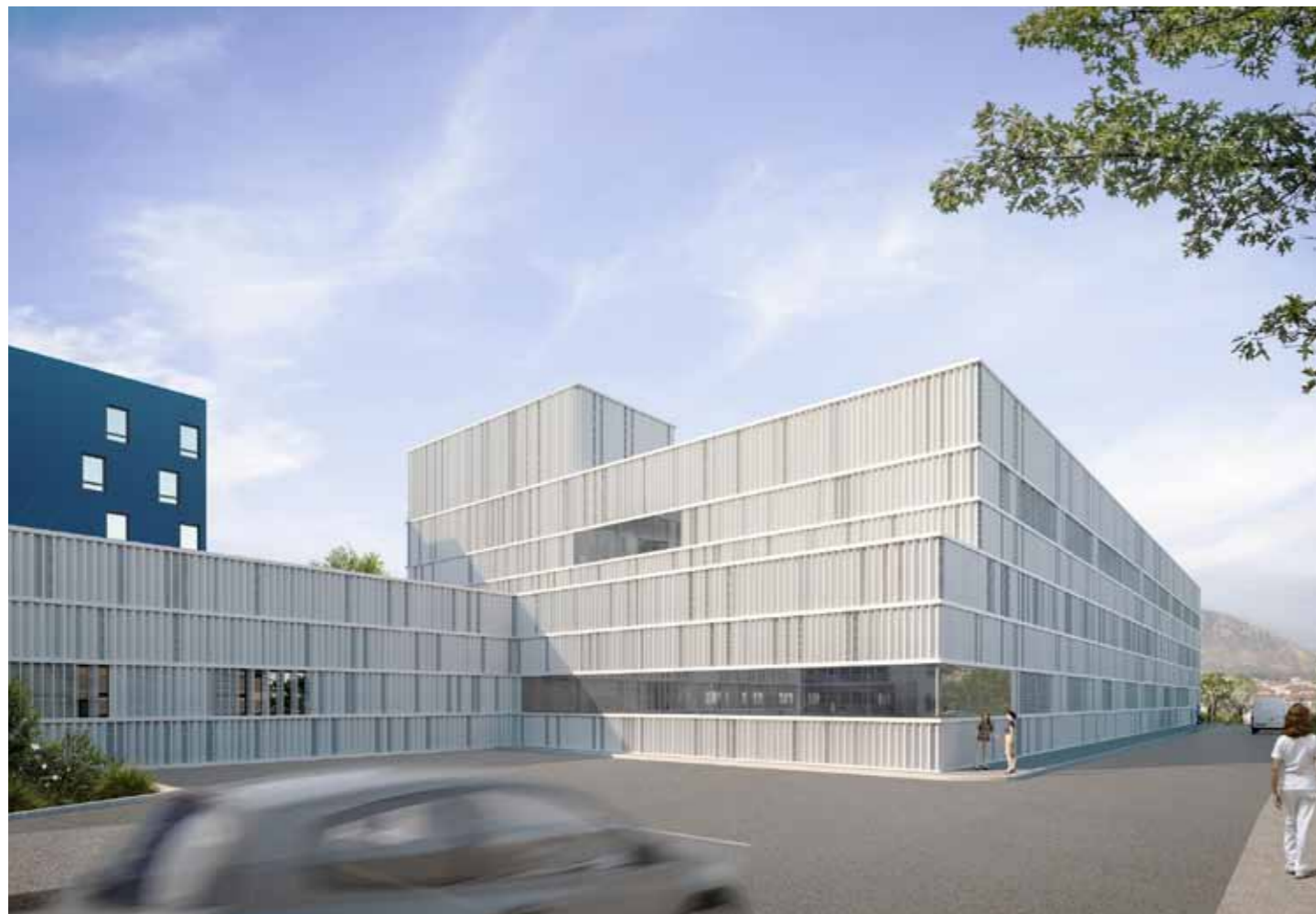
Vue Nord-Est. Par sa composition en strates et sa façade unitaire, le nouveau plateau technique dialogue avec l'existant.