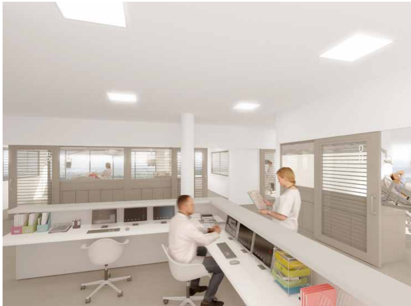
Vue intérieure, service de réanimation / surveillance continue.