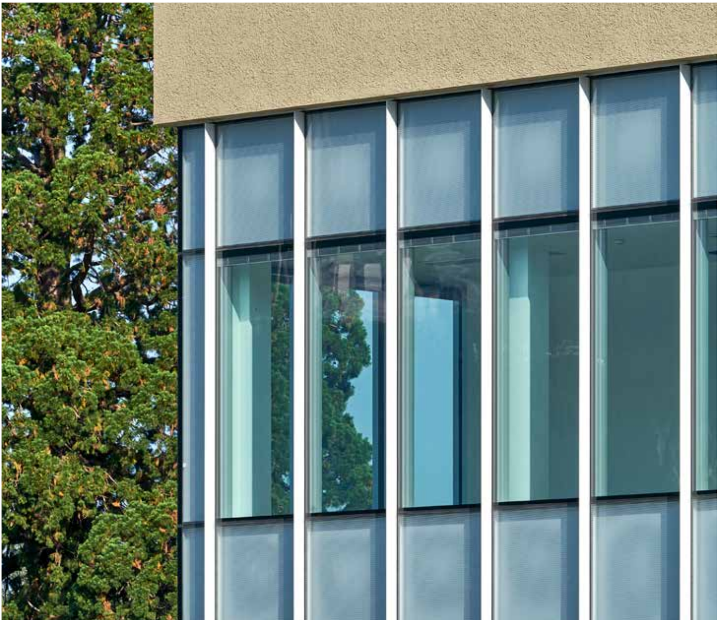
Par son inscription dans le site, son horizontalité, ses cadrages et ses vues, l'hôpital affirme son rapport au Paysage.