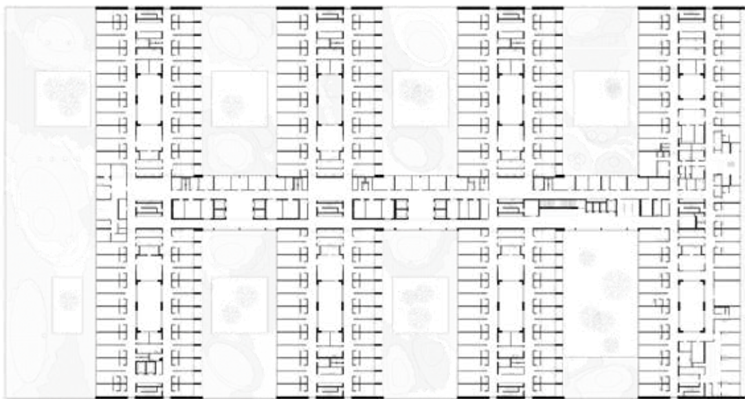
Plan R+2: hébergements