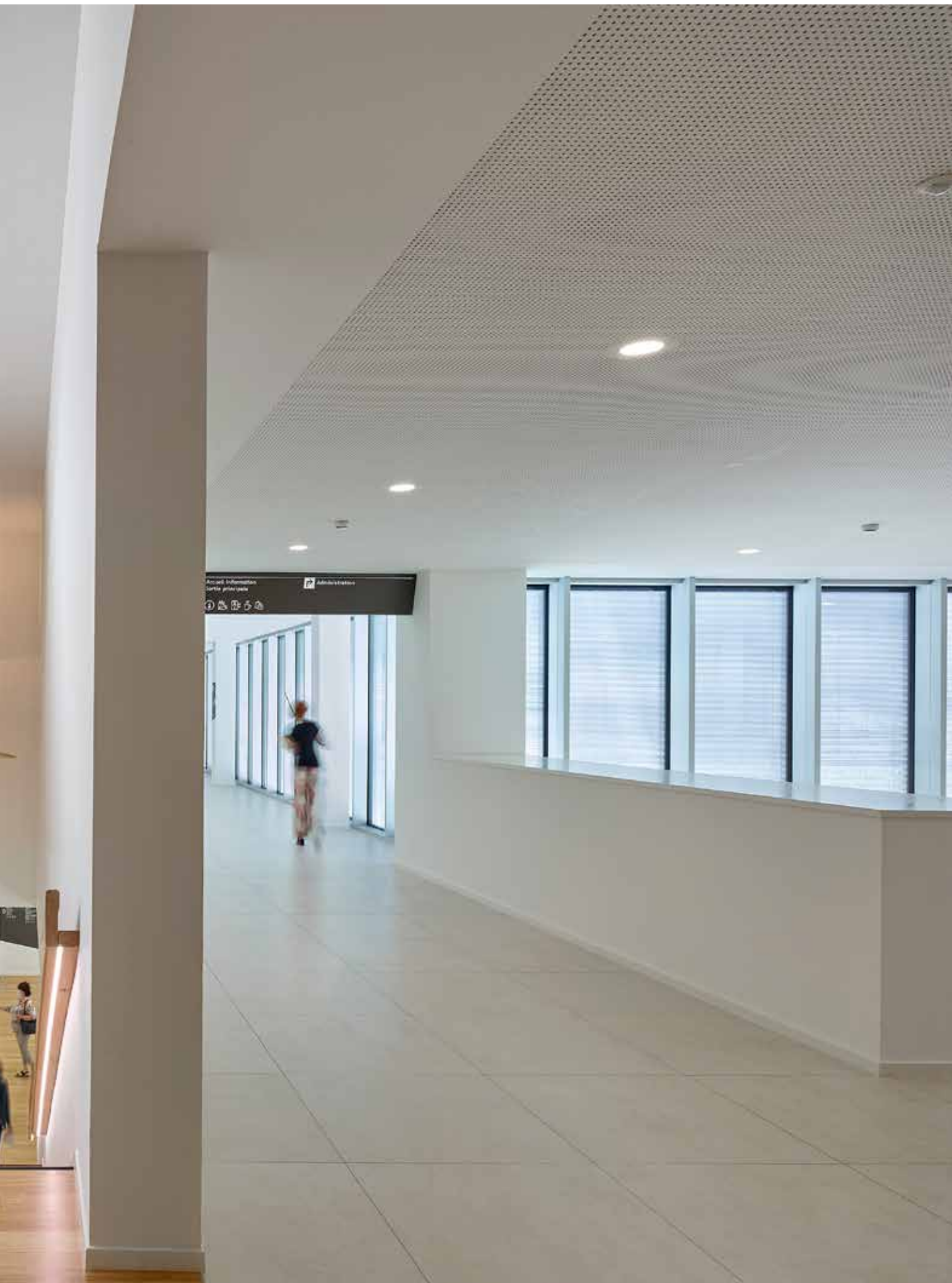
Pour les visiteurs, l'accès est confortable et préservé des ambiances médicales ou techniques, via le hall et son escalier.