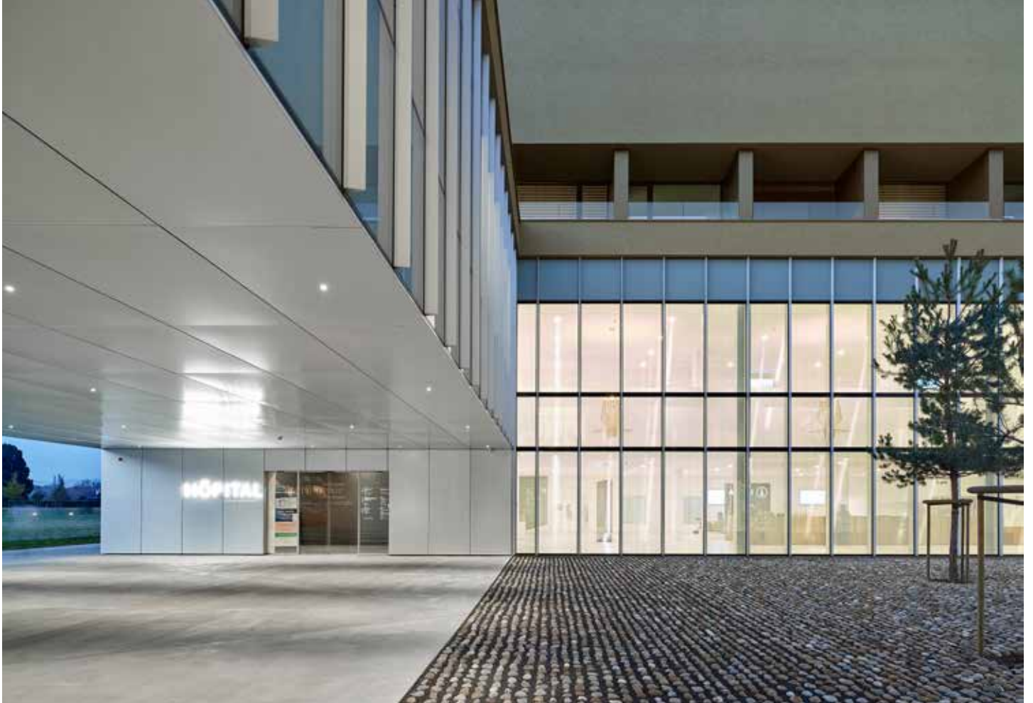
Transparence, ouverture, accès de plain-pied : l'entrée de l'hôpital est lisible, évidente, accompagnante.