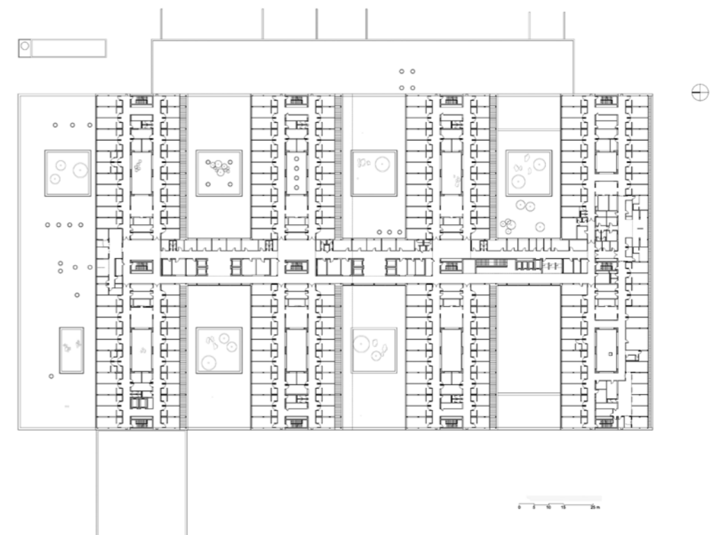
Plan R+2: hébergements