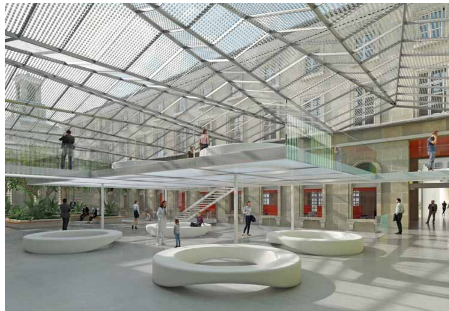
Lieu de vie, le Forum ambulatoire concentre toutes les activités ambulatoires. Lieu repère, il relie et réunit les édifices anciens et contemporains sous sa verrière.