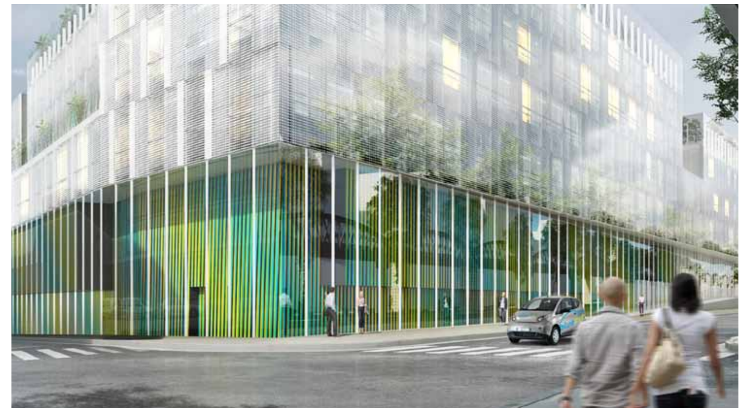
Vecteur de culture et de lien social, l'art renforce le dialogue entre l'Hôpital et la Ville. Au coeur du bâtiment, l'oeuvre d'art cinétique souligne ses parcours.