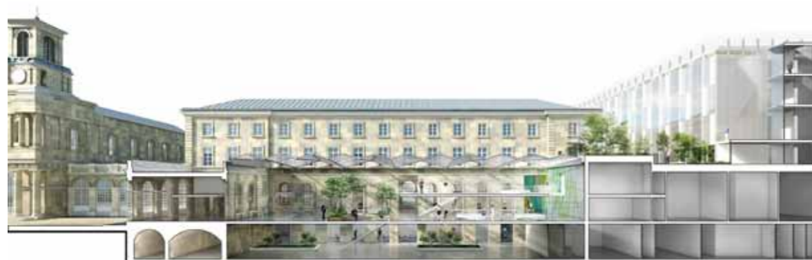
Coupe perspective sur le Forum Ambulatoire