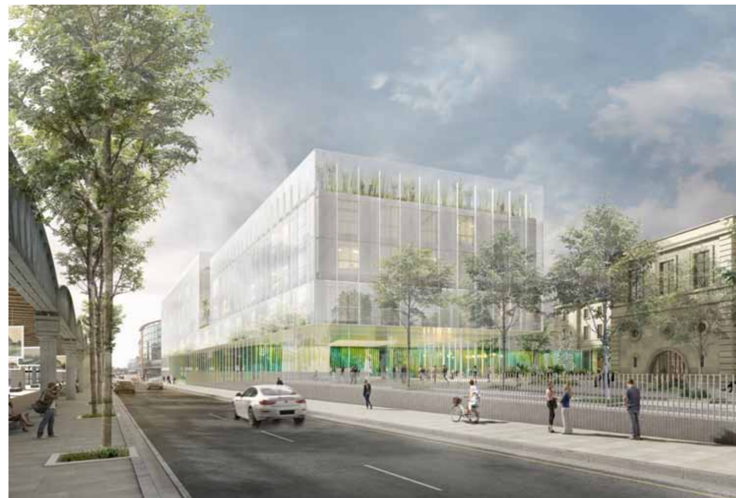
Urbain, ouvert, le Nouveau Lariboisière se tourne vers le Nord. Lisible, le bâtiment devient accessible à tous. Pavillon d'accueil, parvis : la nouvelle entrée vient au devant des Parisiens.