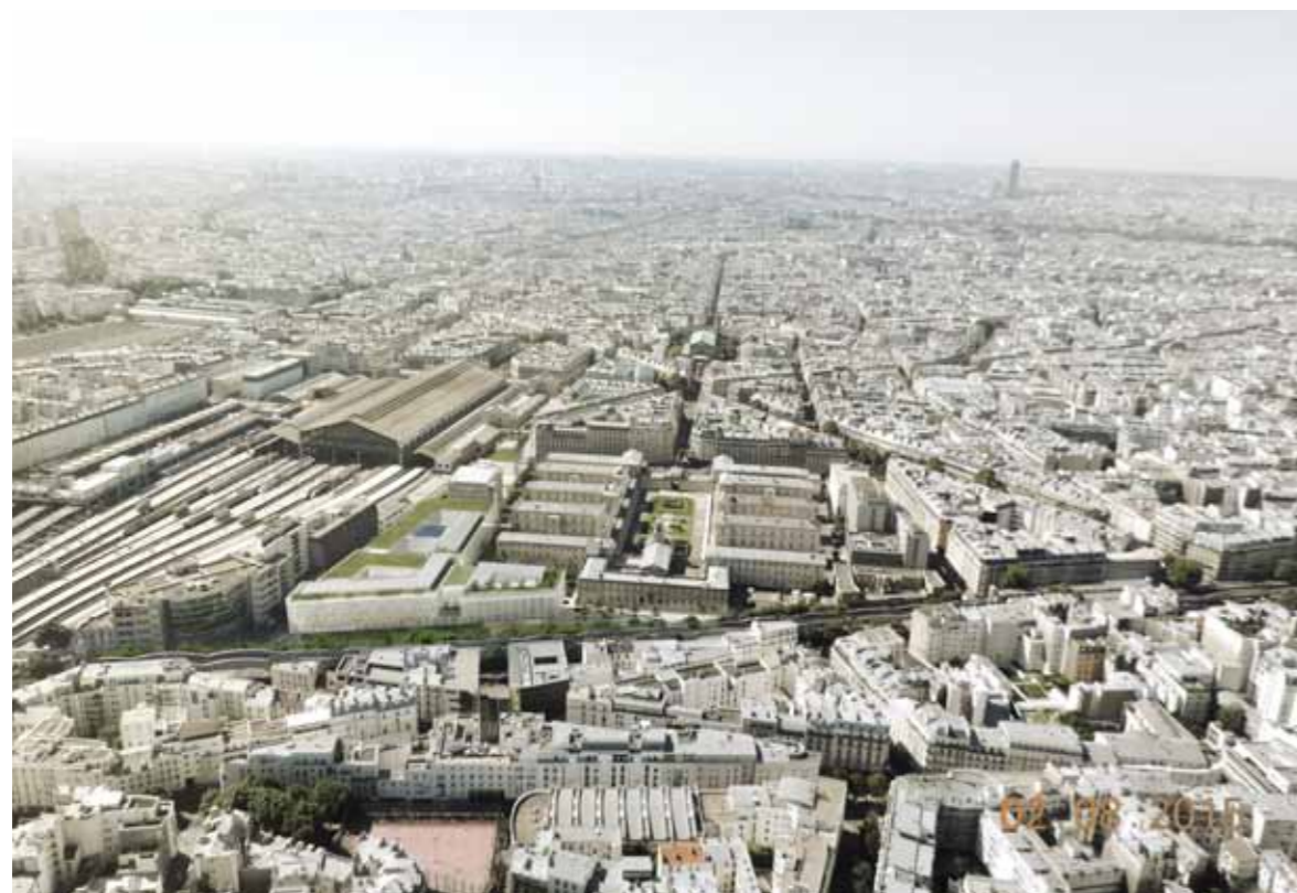
La réalisation du Nouveau Lariboisière est un acte fondateur de la mutation de l'Hôpital dans son territoire. Il restaure une relation harmonieuse avec la ville.

L'oeuvre de Carlos Cruz-Diez, artiste majeur de l'art contemporain et l'un des plus importants théoriciens de la couleur au XXe siècle, conçue exclusivement pour le Nouveau Lariboisière et partie intégrante du bâtiment, affirme son identité nouvelle dans la ville, conforte son unité spatiale en soulignant ses différentes séquences architecturales. Elle redonne ses lettres de noblesse à ce monument parisien, dans une conception contemporaine et ouverte. Paris tout entier en est magnifié.